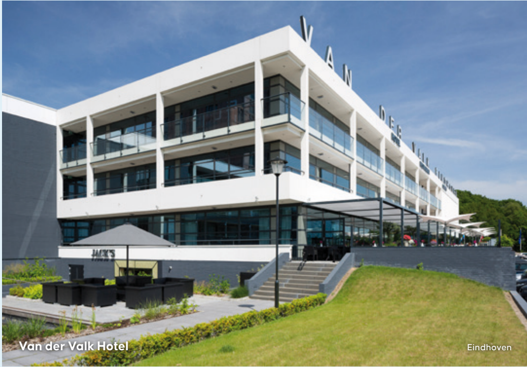
Van der Valk Hotel