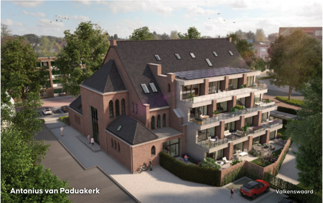
Antonius van Paduakerk