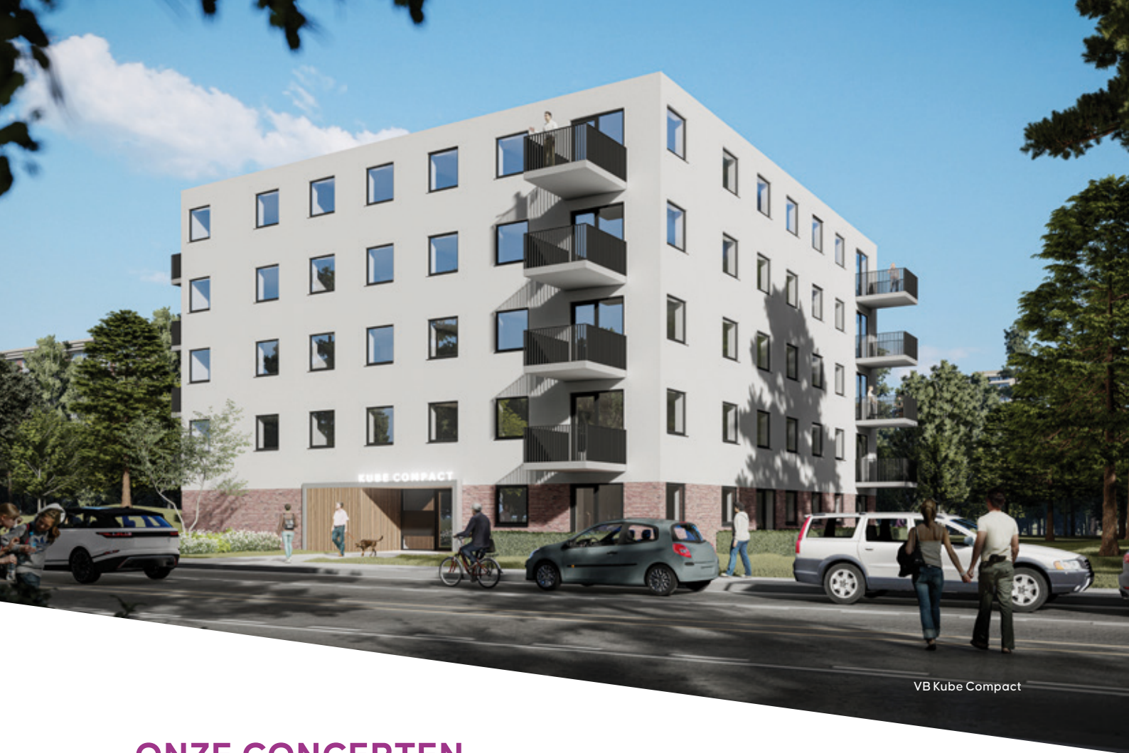
VB Kube Compact