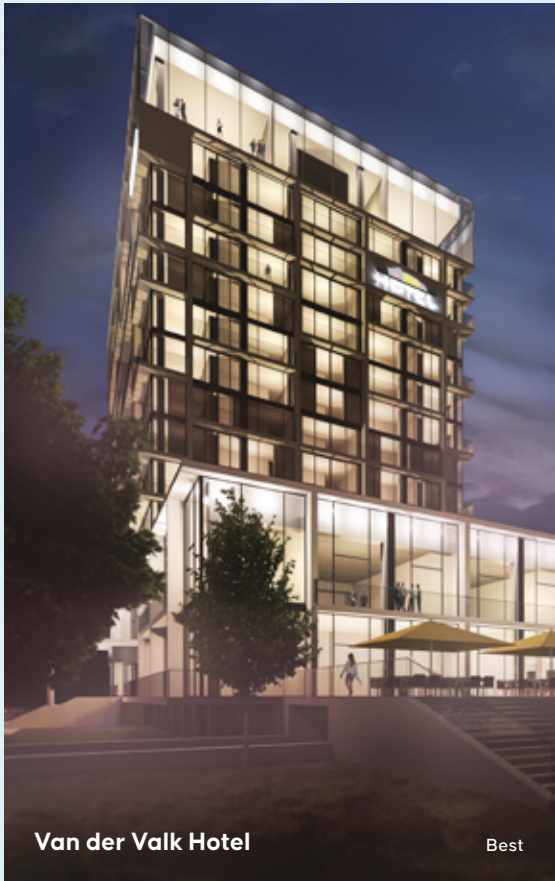
Van der Valk Hotel